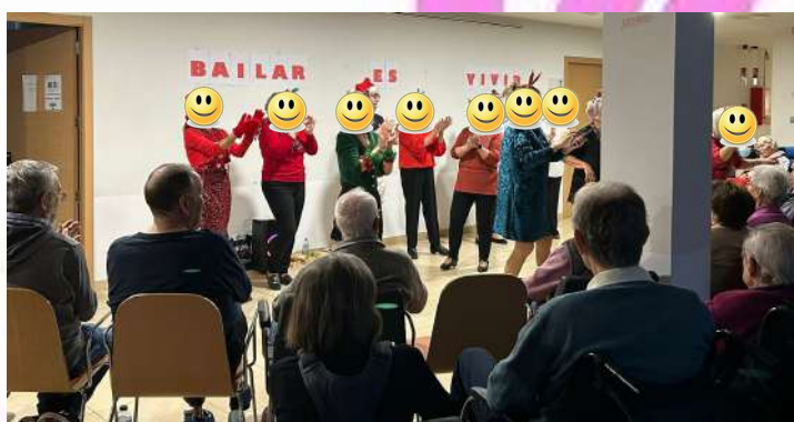
EL GRUPO DE MUJERES DE BAILES EN LINEA BAILAR ES VIVIR

LLAMA QUE PROCURAREMOS CONSERVAR EN NUESTRO INTERIOR DURANTE TODO EL AÑO.