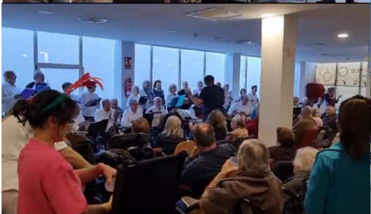
CORO DEL CEAM AVD DEL MAR