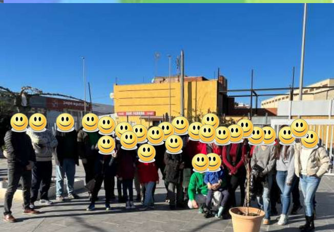
CORO DEL GRUPO CRISTIANO KELAIA