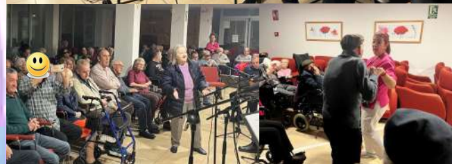
RONDALLA I COR DEL GRUPO LA ONCE